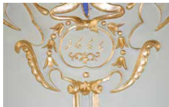
Ill. 2 : détail du plafond stuqué du salon de famille

A peine quelques années plus tard, le comte de Marchin entreprend une seconde campagne de travaux conséquente puisqu'il fait ajouter une nouvelle aile en façade avant, accolée à l'aile orientale d'origine. La dendrochronologie a permis de dater précisément des années 1666-1667 l'abattage des arbres ayant servi aux poutres des greniers de cette partie du bâtiment (ill. 1). C'est aussi à ce moment qu'il fait réaliser l'ensemble des plafonds stuqués du château puisque ces deux millésimes se retrouvent tour à tour inscrits au niveau de certains plafonds (ill. 2).